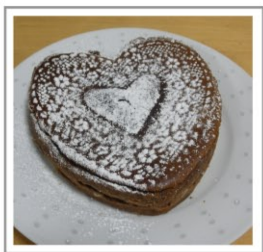
今回はハート型にしてみました(*^_^*)